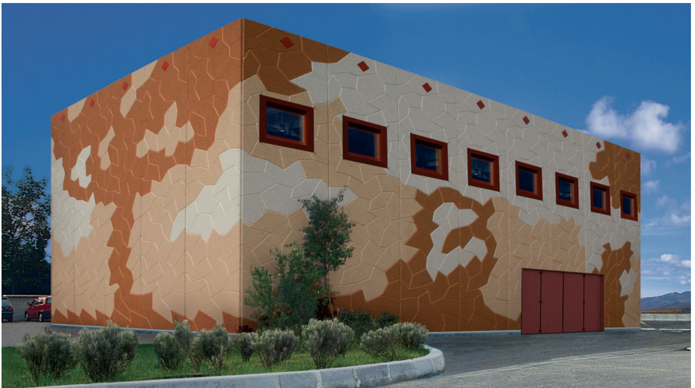
Costruzione Pannelli Multicolor

Il parco macchine ed attrezzature prevede nei due stabilimenti produttivi tre centrali di betonaggio con dosaggio elettronico dei materiali, una vasta gamma di casseri per la produzione degli elementi prefabbricati, linee di movimentazione compresi dumper per il trasporto del calcestruzzo, muletti, trattori e autogru. In una delle due sedi è presente un laboratorio interno di prove materiali in cui vengono svolte giornalmente tutte le attività di ricerca, sviluppo e di controllo secondo le Normative vigenti; a tal proposito la