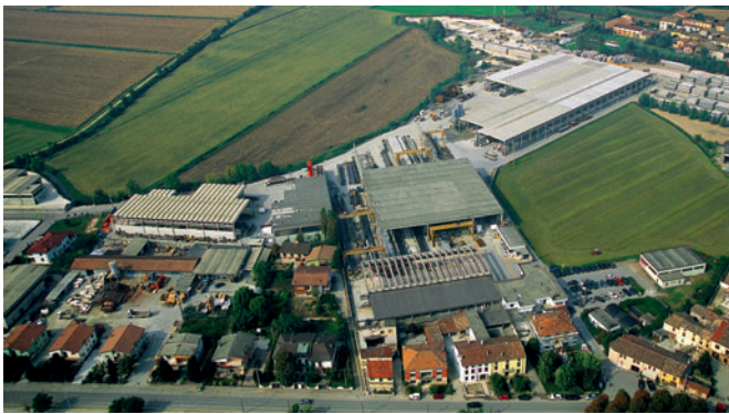
Stai in Acquanegra sul Chiese

La Stai inizia la propria attività nel 1966 ad Acquanegra sul Chiese (MN) e si allarga progressivamente negli anni successivi fino a raggiungere una capacità produttiva annua di 400.000 mq di edifici industriali e commerciali; tale dato è significativo per comprendere la dimensione del successo ottenuto nel centro-nord d' Italia. L' azienda è specializzata in costruzioni che vengono realizzate con i più avanzati criteri della prefabbricazione, impiegando materiali certificati e controllati all'origine ed attrezzature all'avanguardia.