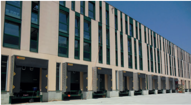
Logistic for Italian Fashion Brand

Prefabbricati Industriali Stai Srl può vantare, a garanzia di prodotti di qualità, la certificazione UNI EN ISO 9001:2008, le certificazioni UNI per i prodotti marcati CE (13224_13225_13693_14991_14992_12839_14843), la certificazione di prodotto in conformità al D.M. 02/04/1998, la certificazione acustica in conformità al CP DOC 252 ICMQ e l'attestazione SOA OS13.